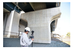
AIひび割れ解析ソリューション