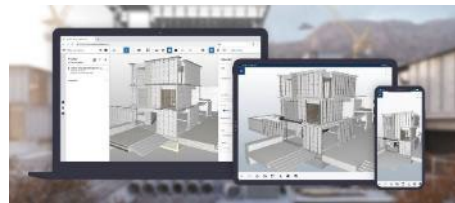
Trimble Connect & ポイントクラウドビュー (新クラウドソリューション)