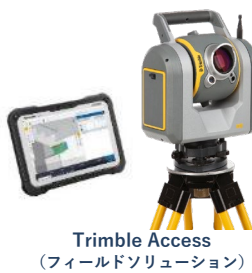
Trimble Access (フィールドソリューション)