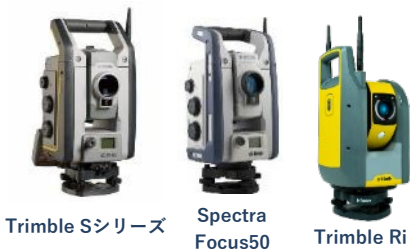
Trimble Sシリーズ Spectra Focus50 Trimble Ri

多くの機能を持つフィールド機器からオフィスソフトまでを一度に体感いただけます。是非この機会にご興味のある製品の操作性をご試用ください。会場・機材・天候により屋外でのデモンストレーションも可能な場合もございます。（下記以外に協賛各社のソリューションも展示いたします）