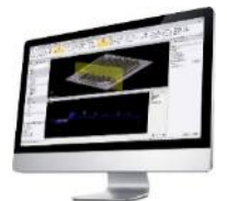
Trimble Business Center Trimble RealWorks TOWISE (オフィスソフトウェア)