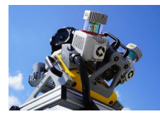
Trimble MXシリーズ (出展できない会場もございます)