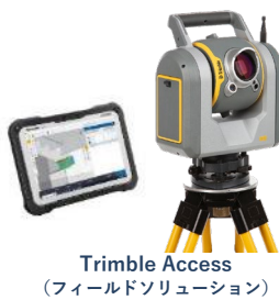
Trimble Access (フィールドソリューション)