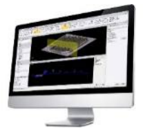
Trimble Business Center Trimble RealWorks TOWISE (オフィスソフトウェア)